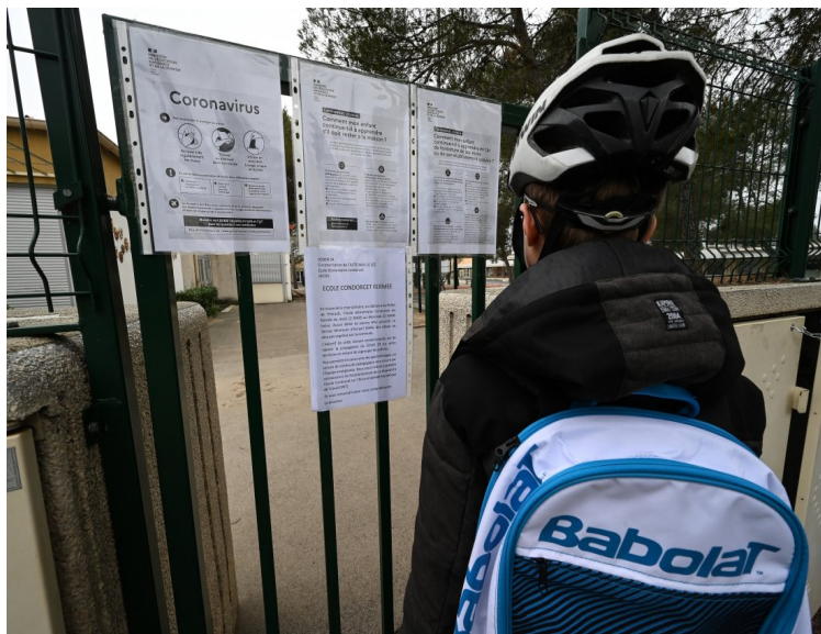
Niño ante una escuela cerrada

Publicado el 17 de noviembre de 2020 en Francesoir .